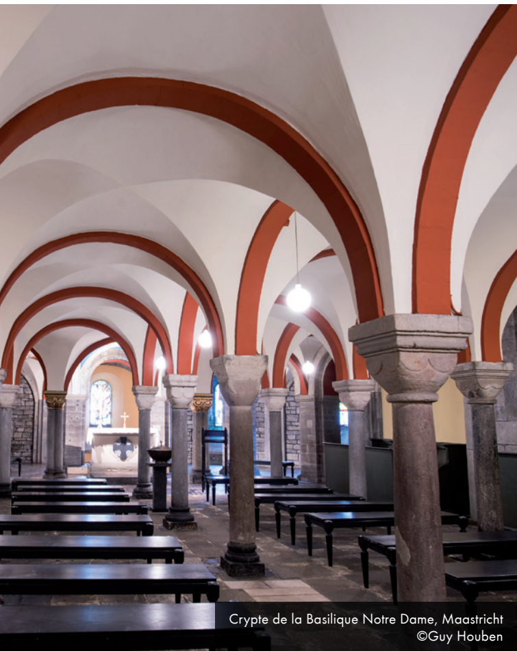
Crypte de la Basilique Notre Dame, Maastricht