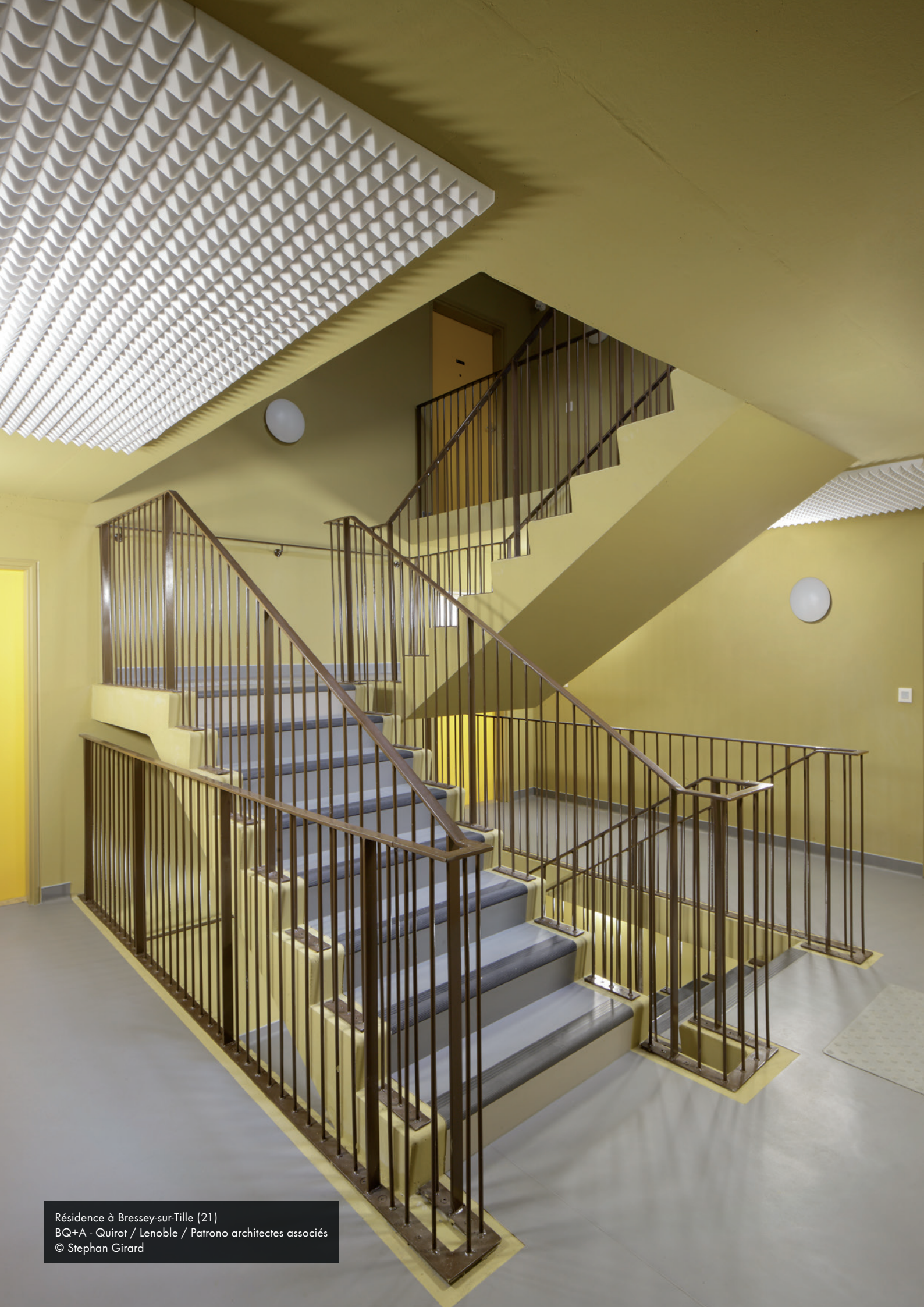
Résidence à Bresse-sur-Tille (21) BQ+A - Quirot / Lenoble / Patrono architectes associés