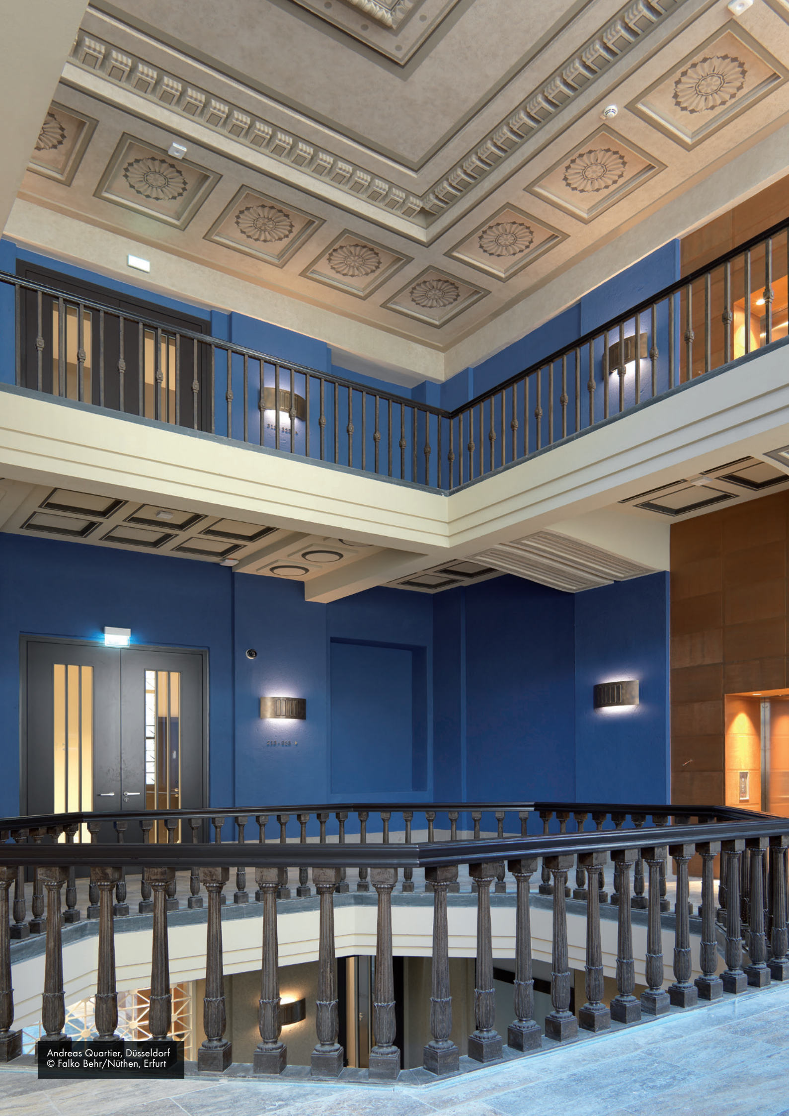
Andreas Quartier, Düsseldorf