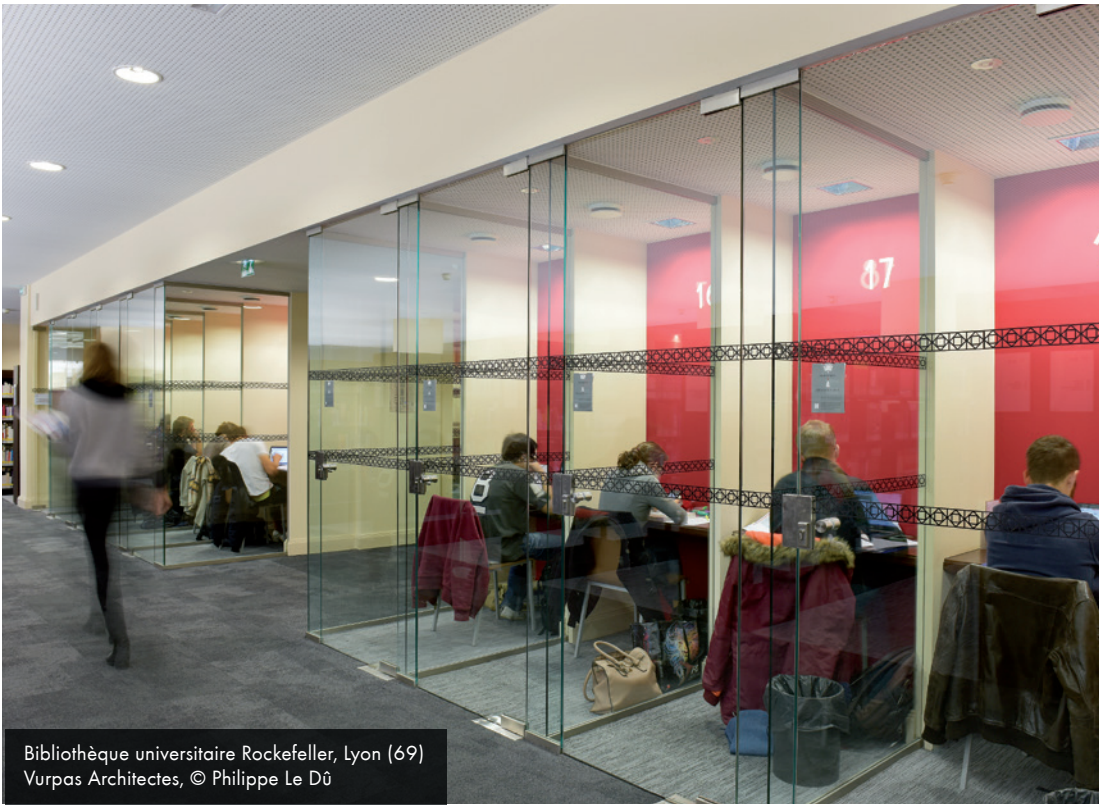
Bibliothèque universitaire Rockefeller, Lyon (69) Vurpas Architectes, © Philippe Le Dû